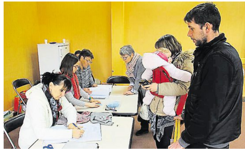
La météo pluvieuse n'a pas favorisé la fréquentation de la bourse. Pour les parents qui se sont déplacés, les bonnes affaires ont été au rendez-vous.

Dimanche, Familles rurales a organisé une bourse aux articles de puériculture. Les parents ont fait des bonnes affaires.